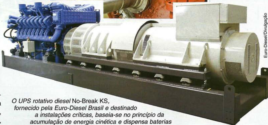
O UPS rotativo diesel No-Break KS, fornecido pela Euro-Diesel Brasil e destinado a instalações críticas, baseia-se no princípio da acumulação de energia cinética e dispensa baterias